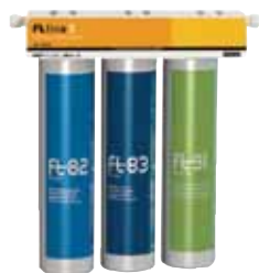
Para nuestra casa. FT Line 3