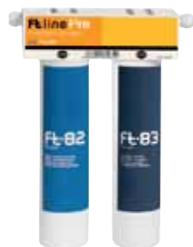
Para proteger nuestro grupo de ósmosis. FT Line Pre