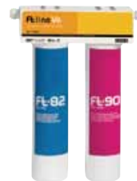
Protector de cafeteras. FT Line VE