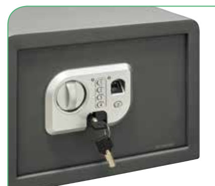
Dispone de llave de emergencia