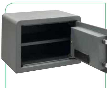
Dispone de bandeja interior