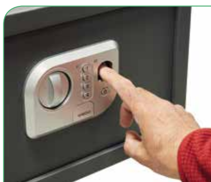
Con lector de huella dactilar