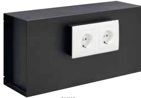
SUKO Ref. 23100W-S1