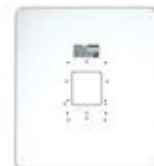
F03389 MARCO UNIVERSAL LARGE