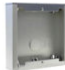
F07061 CAJA SUPERFICIE CITY S1