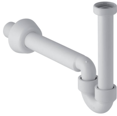
Imagen de ejemplo