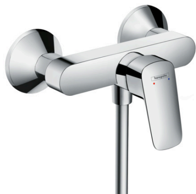
Ilustración del producto