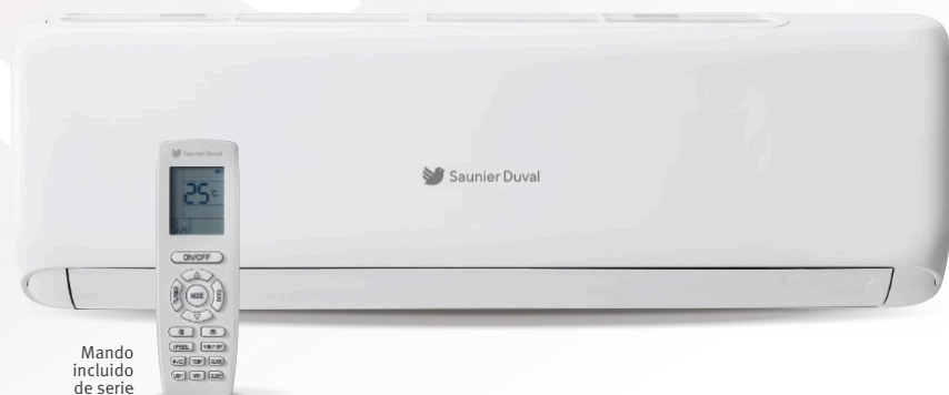
Mando incluido de serie

Aire acondicionado con bomba de calor. Supersilencioso y conectado