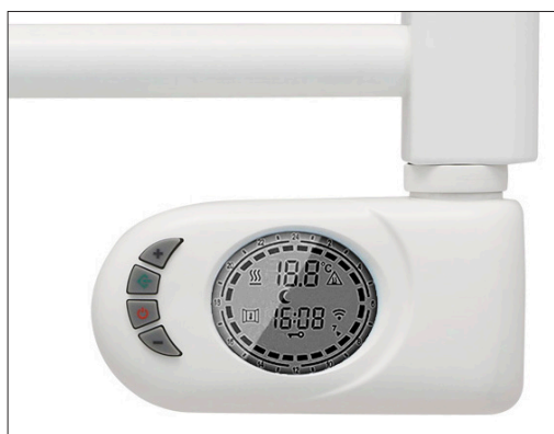
T700PE | T400PE | Detalle control | TPE