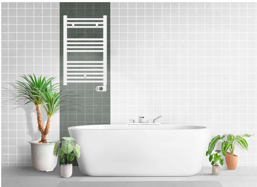
Modelo expuesto T400PE (879 x 500 mm) | Blanco recto

TOALLERO ELÉCTRICO FLUIDO CON CONTROL PROGRAMABLE