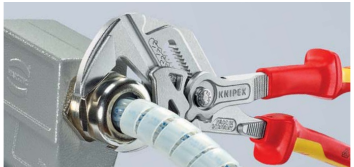
Trabajar sin dañar las superficies sensibles; como variante VDE también para instalaciones eléctricas