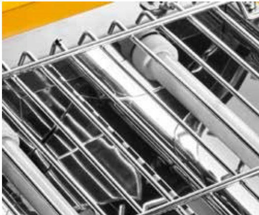
Rejilla protectora cromada.