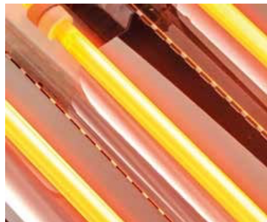
Eficientes lámparas infrarrojas de cuarzo.