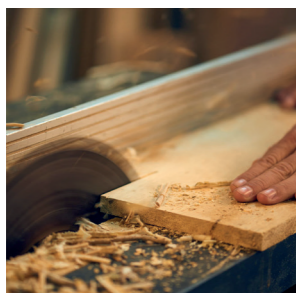
Tecnología y ecología