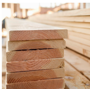
Selección de las mejores maderas

Varias generaciones fabricando escaleras de madera