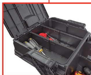
*Compartimentos con separadores