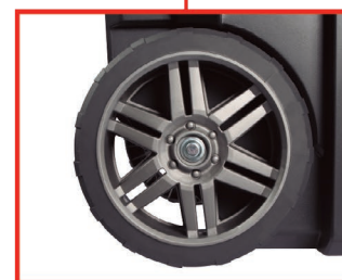
Ruedas de goma ø 18 cm