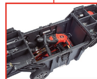
*Capacidad interior 57 litros