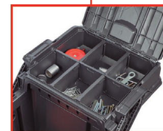
*Compartimentos con separadores