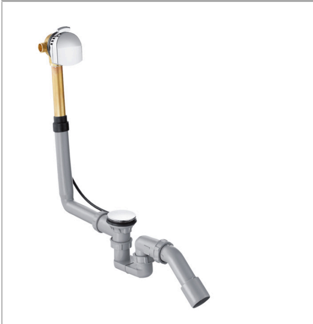
Ilustración del producto