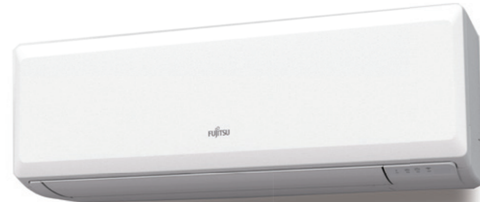
ASY 25 -35 UI-KP