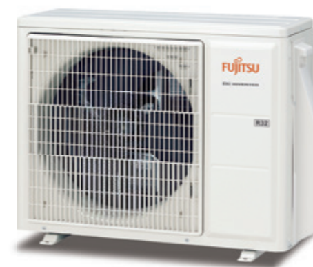
ASY 25 -35 UI-KP