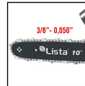
CADENA 40 ES LABONES