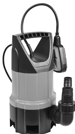
Serie AS 7993 X 412