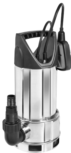
Serie AS 7993 X 415