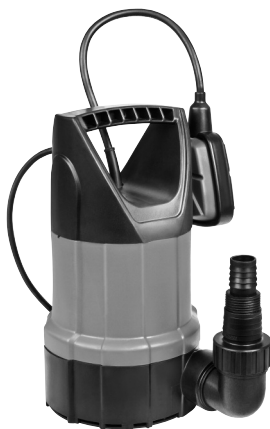
Serie AL 7993 X 411