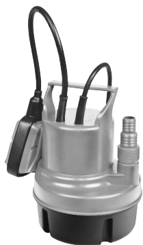
Serie AL 7993 X 410