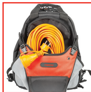
Bolsillo ajustable para objetos voluminosos