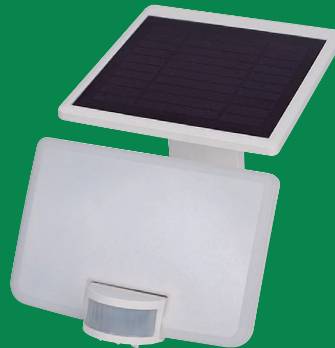
2 modos de montaje: