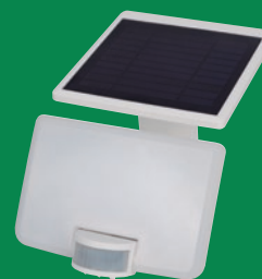
Combinado Foco y acumulador acoplados.