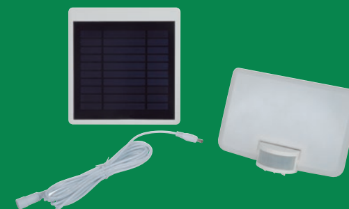
Separado Foco y acumulador separados, conectados mediante alargo.