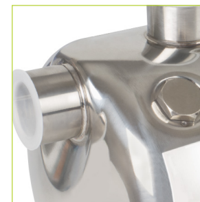
SALIDA DE IMPULSIÓN \varnothing 1"